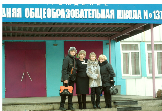
На крыльце школы №137