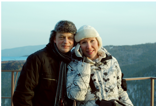
На смотровой площадке в Бобровом логу