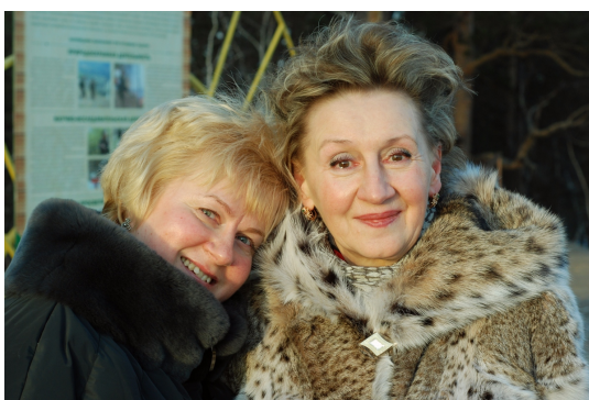
Слезы гостей из Мурманска