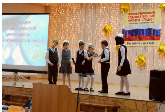
Ученики начальной школы