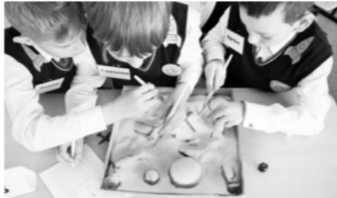
Исследовательская работа на открытом уроке

31 октября - 3 ноября Творческий союз учителей Красноярского края при поддержке Министерства образования региона, Дома работников просвещения, краевой организации Общероссийского Профсоюза образования, красноярского педагогического колледжа №1 им. М. Горького и средней школы №3 города Бородино провел третью региональную школу «Учитель года Красноярского края». За эти три дня участники школы дали 55 уроков, 67 мастер-классов. Работали 33 модератора, 8 методистов Творческого союза учителей, 11 методистов педагогического колледжа №1 им. М. Горького. На уроках обучались 576 учеников, 160 студентов, гостями стали 262 учителя, 15 студентов. А теперь подробности от организаторов и участников.