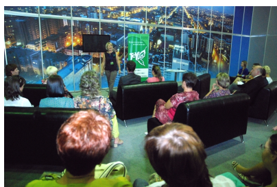
Закрытие Краевого методического практикума

Все фотографии с СОФ-2015 смотрите здесь.