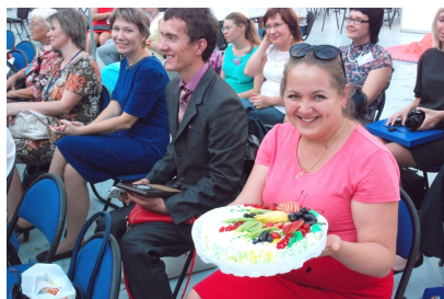
Поздравление Творческому Союзу Учителей от "Сибири"